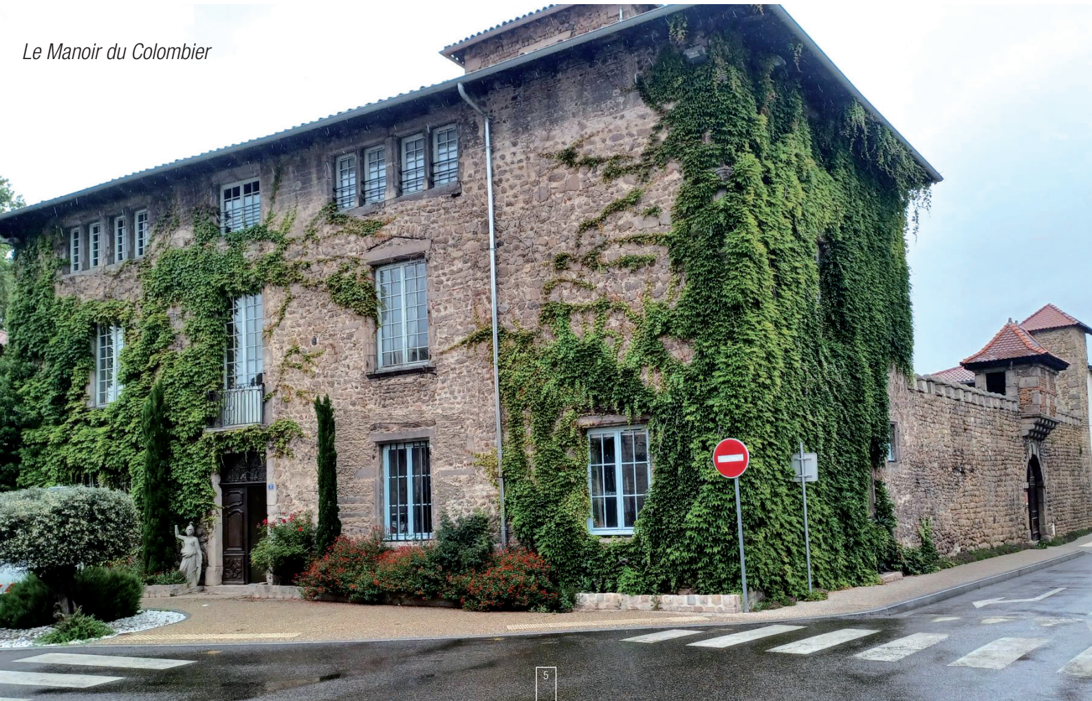
Le Manoir du Colombier