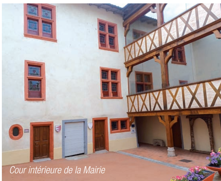
Cour intérieure de la Mairie