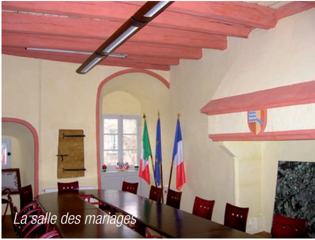
La salle des mariages