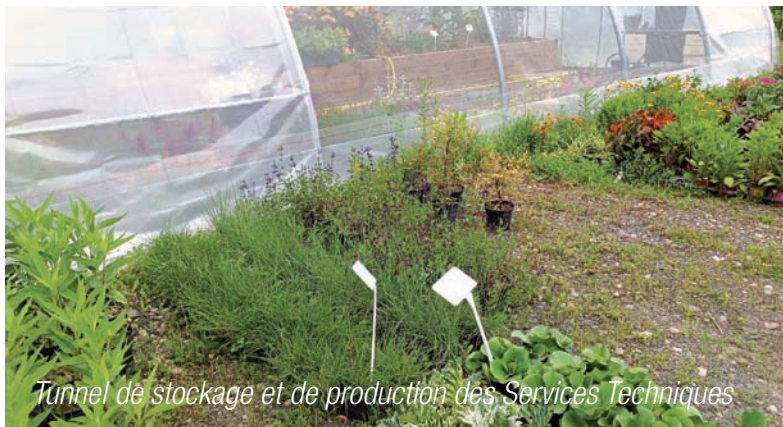
Tunnel de stockage et de production des Services Techniques