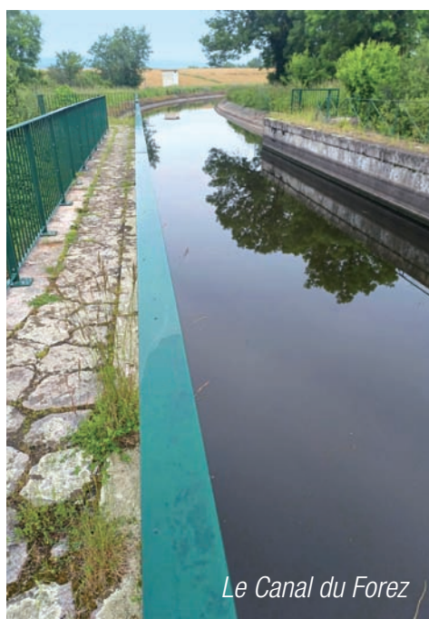
Le Canal du Forez

Le Canal du Forez, d'une longueur de 44 km, est alimenté par le fleuve Loire (prise d'eau sur le barrage de Grangent). Il permet l'irrigation des terrains agricoles et l'arrosage des massifs municipaux.