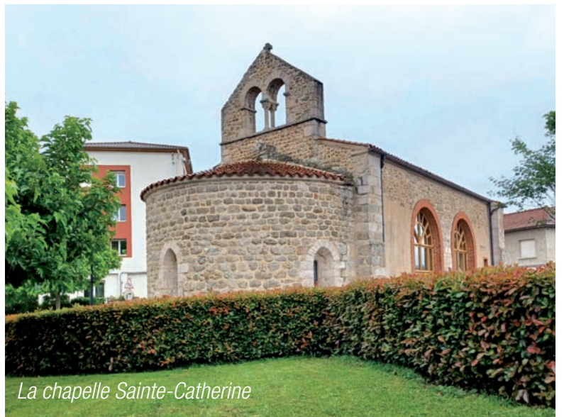
La chapelle Sainte-Catherine