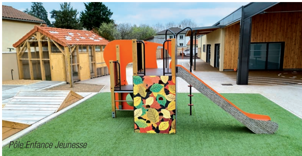
Pôle Enfance Jeunesse

Un Pôle Enfance Jeunesse a ouvert en 2023 afin d'accueillir 530 élèves. Il regroupe les accueils périscolaires, la cantine et des salles d'activités.