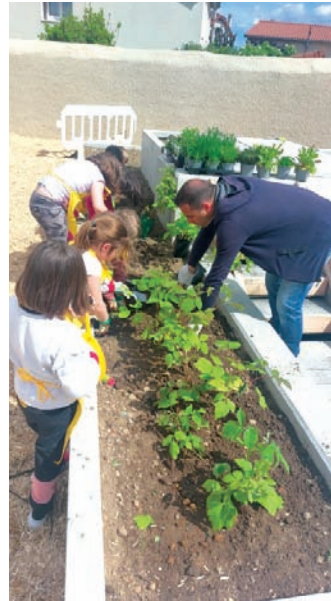
Plantation en présence des enfants

Les encouragements et les remarques formulés dans le cadre de la campagne “fleurir la Loire” nous ont permis de progresser et d’améliorer notre fleurissement et la qualité de nos aménagements.