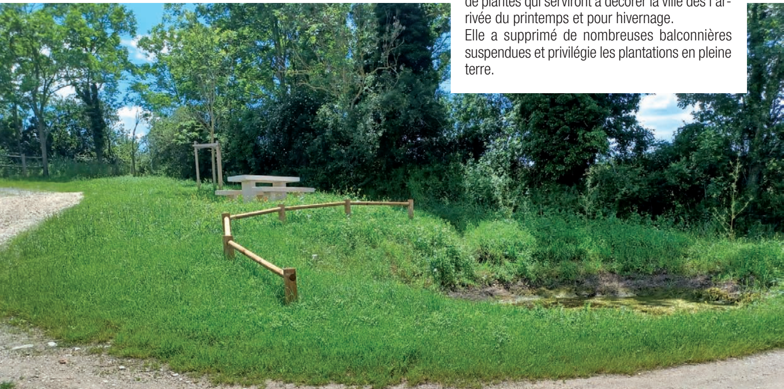
La mare de l'Hospitalet

Elle a supprimé de nombreuses balconnières suspendues et privilégie les plantations en pleine terre.