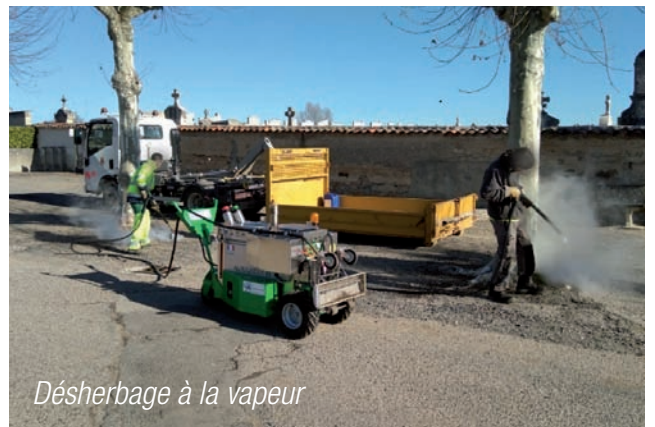
Désherbage à la vapeur