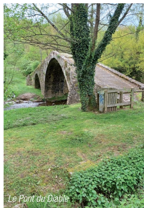
Le Pont du Diable