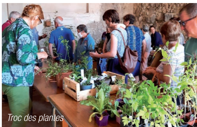
Troc des plantes