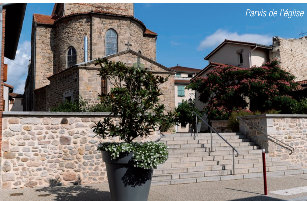
Parvis de l'église

Elle participe à l'élaboration du GRP6 "Rails et Rambertes" avec Loire Forez Agglomération.