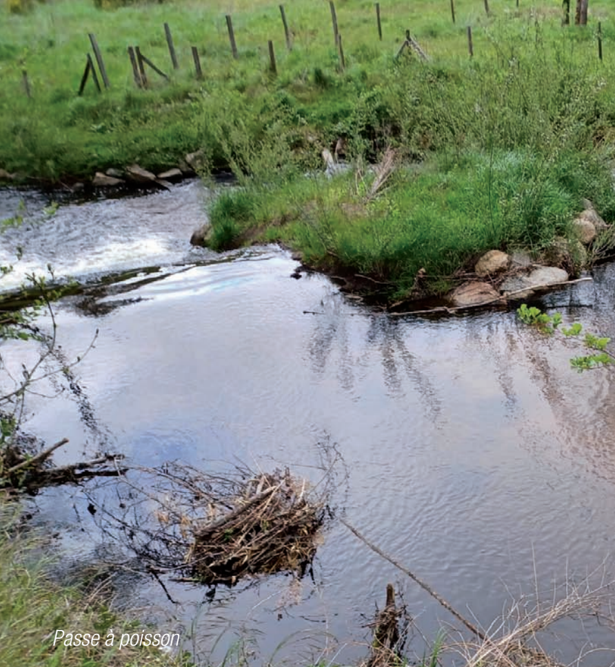
Passé à poisson

La commune a engagé un important travail d'aménagement de zones "apaisées" et de pistes cyclables pour améliorer la sécurité des modes doux et diminuer les nuisances sonores. Elle invite les usagers à stationner leurs véhicules hors du centre-bourg grâce à une signalisation adaptée. Elle a ainsi obtenu le label "Ville Prudente".