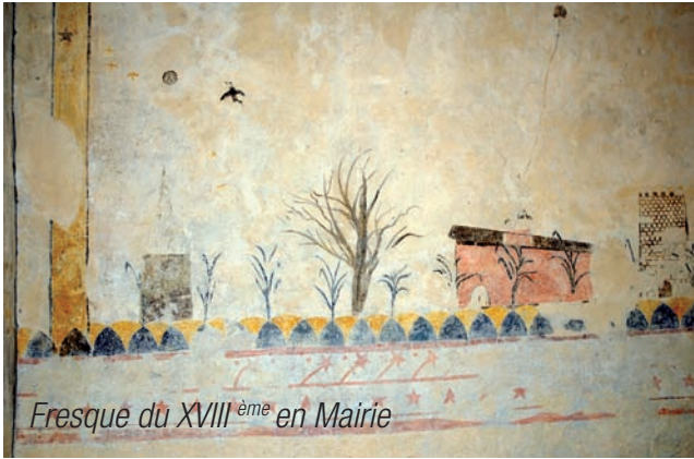
Fresque du XVIII ème en Mairie